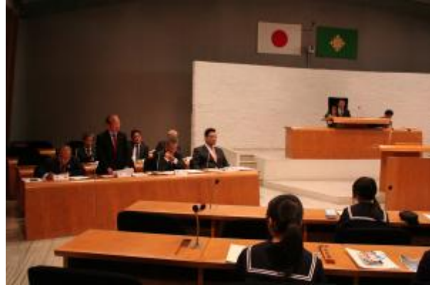
旧議場での中学3年生の主権者教育

このたびの新議場オープンを契機として、心機一転、市民の皆様により身近に感じていただける議会を目指し、これからも取り組んでまいります。(了)