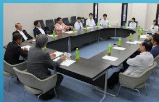
高校生議員との意見交換の様子

交流を通して「議員を身近に感じることができた」「議員の政策や活動をもっと知りたいと思うようになった」などの感想をいただきました。