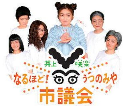
1人6役で議会の取り組みを紹介

今後も議会の取り組みを分かりやすく周知するとともに、市民にとって議会をより身近に感じられる番組制作を進めていきます。（了）