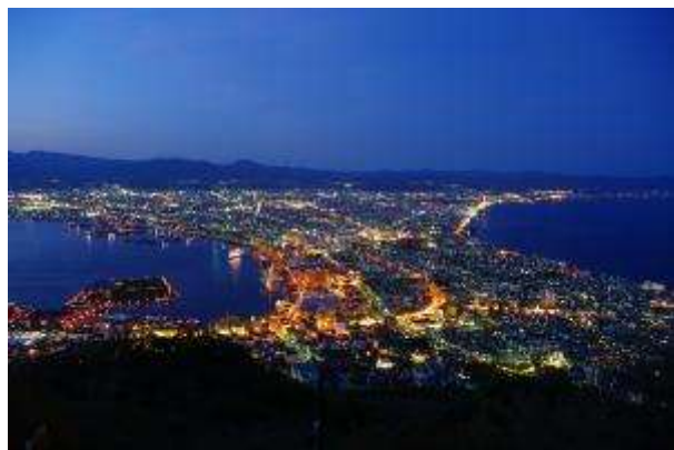
函館山からの夜景