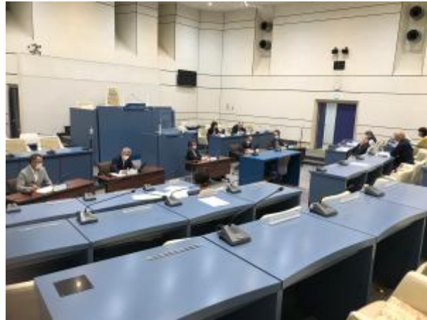
議会モニター会議

引き続き議会モニターの意見から改善に努め、市民に分かりやすい議会を目指していきます。 (了)