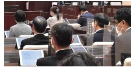
タブレット端末を用いた本会議