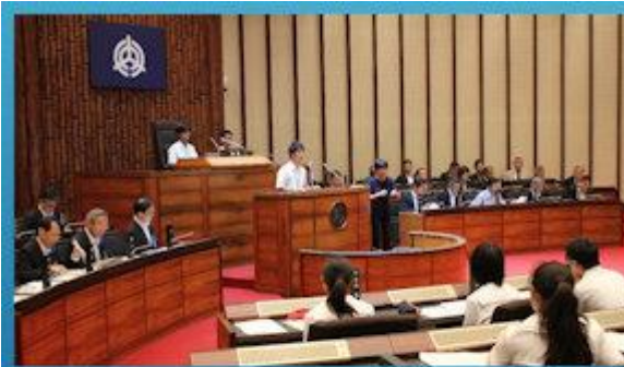
高校生議員による一般質問の様子