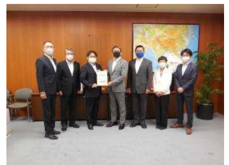
議長（中央）に報告書を手渡す議会基本条例検証委員会委員