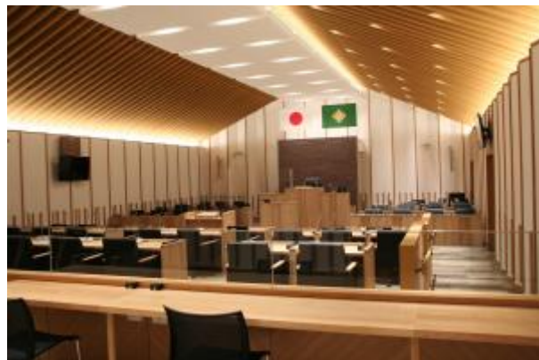
岩見沢市議会新議場