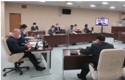
総務委員会に東京事務所がオンラインで出席

機能面では、カレンダーによる会議日程の確認や掲示板での情報共有のほか、既読確認機能により、確実に伝えたい情報の周知状況を把握できるなど、業務の効率化につながっています。今後はビデオ通話を活用したオンライン委員会の開催や有事の際の安否確認など様々な取組に活用していきます。