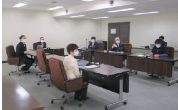
第22回 ICT化推進検討会議（令和4年2月4日開催）

令和4年第2回定例会からの議案書の完全電子化を皮切りに、取り組みを加速させることを目指しています。（了）