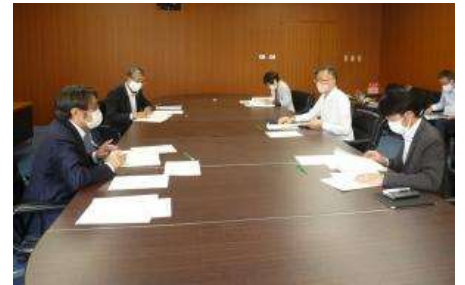
議会基本条例検証委員会による議論の様子

具体的な取り組みとしては、本市議会が平成30年に策定した「北九州市議会災害・市民安全確保対応指針」に基づき、議員は「地域の一員として共助の取り組みの円滑化に努め」、議会は「執行部の取り組みに対し必要な協力・支援を行い」、「国・県等に適時適切な要望活動を行い」、「議員から提供された情報・要望等を一元化し執行部に要請する」など迅速かつ的確に行動することとしており、本市議会は今後も、これらの取り組みを通じて市民の負託にしっかりと応えてまいります。（了）