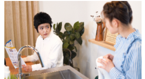
第1回（令和2年6月）放送の様子