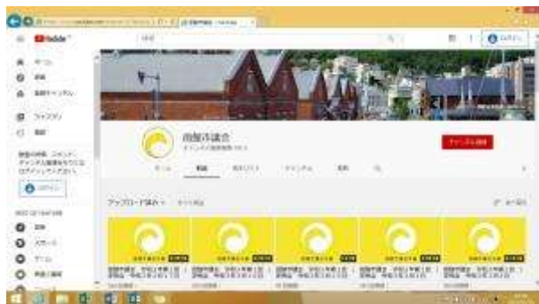
函館市議会YouTubeチャンネル