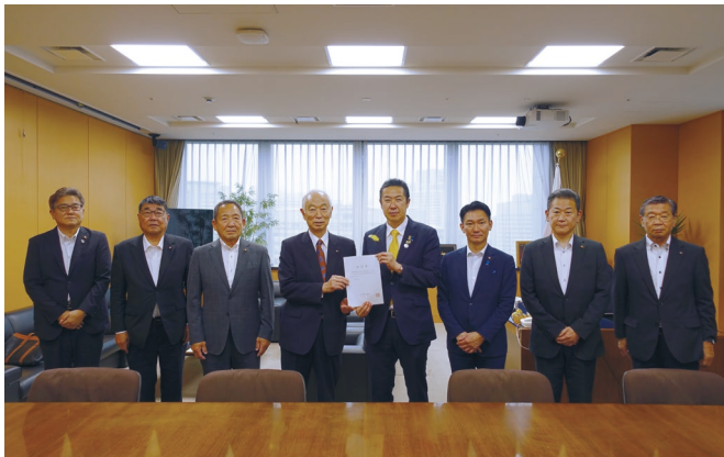
黄川田地域未来戦略担当大臣(右から4人目)に要望

その後、若者や女性をはじめとする多様な人材の市議会への参画促進や議会活動の活性化が市議会の緊要の課題となっており、また、人口減少や高齢化の進展に伴い、特に小規模市町村では議員のなり手不足が深刻化し、来年の統一地方選挙への影響も懸念されている。こうした状況を踏まえ、理事会に先立って開催された第249回部会長会