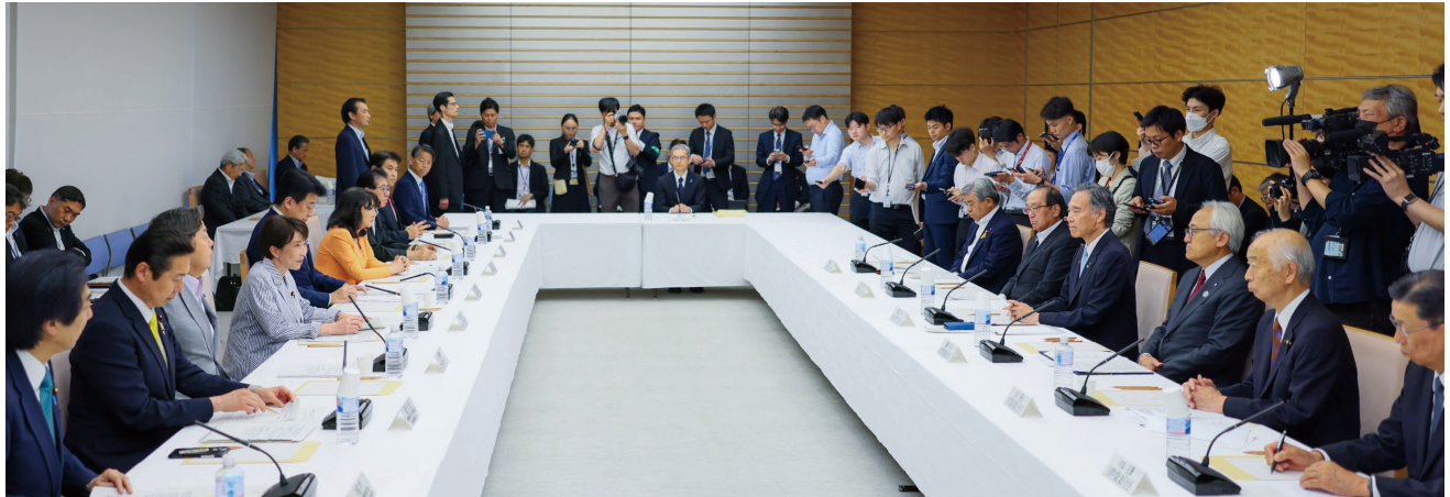
国と地方の協議の場（令和8年度第1回）の会合の様子

令和 8 年度第 1 回国と地方の協議の場が 6 月 29 日、首相官邸で開かれ、「骨太の方針」の策定等について、地方六団体代表と高市早苗首相はじめ関係閣僚が協議した。本会からは丸子善弘会長（山形市議会議長）が出席し、▽各種災害対策の推進▽地方創生▽多様な人材の地方議会への参画の 3 点について意見を述べた。