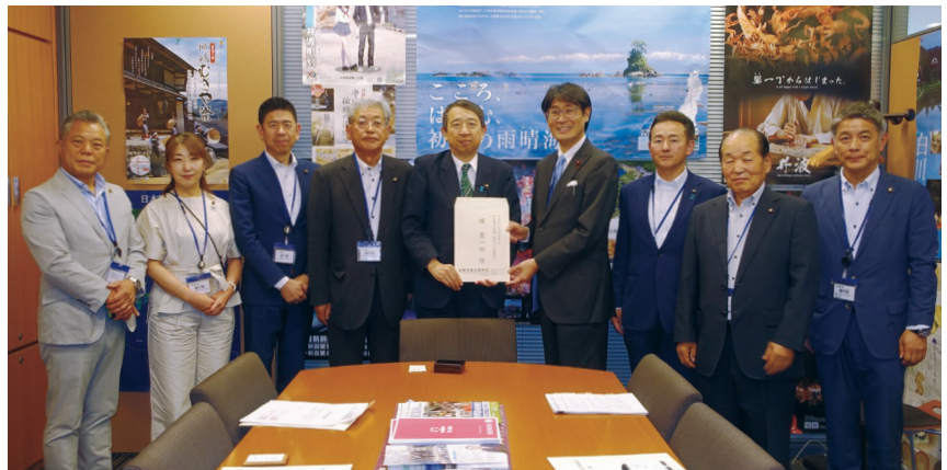
橘自民党地方議会の課題に関するPT幹事長 (中央) に要望