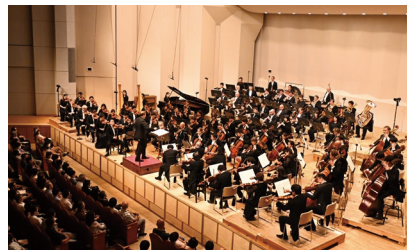
「セイジ・オザワ 松本フェスティバル」