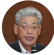
角掛副委員長 (滝沢市)

た部会提出決議と会長提 出決議を踏まえて作成 した要望書を協議・決定 し、各委員会共通の「令 和6年能登半島地震に関 する要望書」「東日本大 震災に関する要望書」と 併せて、要望活動を展開 する。