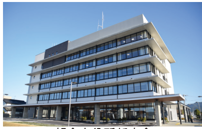
朝倉市役所新庁舎