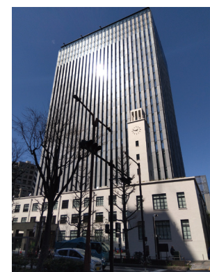
川崎市役所新庁舎