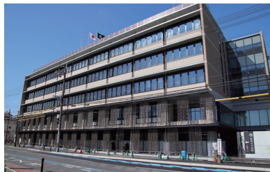
長岡京市役所新庁舎