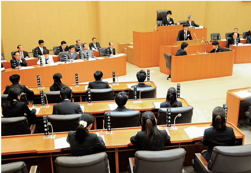
学生議会のもよう