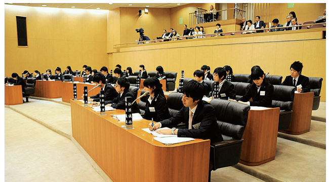
学生議員の表情は真剣そのもの

学生議会は通常の市議会本会議と同様、本会議場で開催されます。選ばれた学生議員は皆、順番に登壇。学生議員の一般質問に対し、答弁に立つ理事者の役回りは越谷市議会