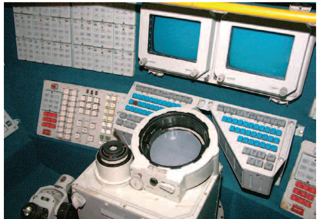
ドッキングした宇宙ステーション「ミール」と天体観測室「クバント」(上)コクピット内(下)