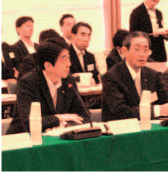
会議に出席する藤田本会会長（右写真、右端）、中村地制調会長（左写真、右）、安倍首相（同、左）

また、国庫補助負担金や地方交付税、税源移譲を含めた税源配分の見直しの検討を進める。併せて、法人二税を中心に税源が偏在するなど、地方公共団体間で財政力に格差があることを踏まえ、地方間の税源偏在を是正する方策について検討し、格差の縮小を目指す。