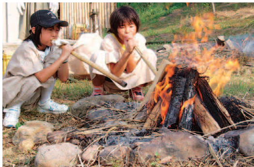
「火起こし」を体験する子どもたち

土した土器は「安国寺式土器」と命名され、九州の弥生時代後期を代表する「標識土器」となっています。また、60年から63年に行われた遺構確認調査では、高床建物や建築材、農具、機織りなどの木製品が良好な状態で出土し、学術的に高い評価を受けました。こうした遺跡の重要性から現在は「弥生のムラ・安国寺集落遺跡公園」として整備され、園内には「国東市歴史体験学習館」を平成13年にオープン