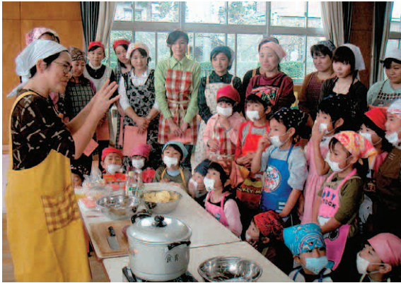
食育講座を受ける園児たち

三条市では平成15年9月から、学校給食の主食を基本的に毎日米飯として実施しています。米をはじめ副食の食材は、地元の農産物を活用し、子どもたちが健康に生きるた