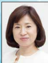
田中 里沙 事業構想大学院大学学長 宣伝会議取締役