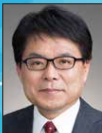
増田 寛也 東京大学公共政策大学院 客員教授