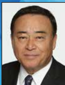
梶山 弘志 内閣府特命担当大臣 (地方創生、規制改革)