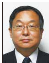
人羅 格 毎日新聞社 論説副委員長

※プログラム及び出演者の一部は、予告なく変更になる場合があります。予めご了承ください。