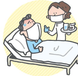
特定感染症を発病して入院