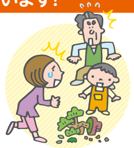
同居の子供や孫が他人のものを破損させた