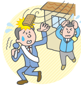
日常生活や議員活動中の事故によるケガ