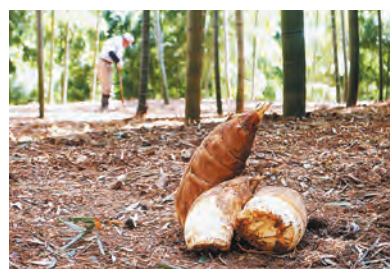
特産品たけのこ(同)

のだ。たけのこなどの特産品をはじめ、体験型の商品も用意する。 返礼品を扱わなかったこの3年間。「こどもたち」に本を贈ろうプロジェクト」は総務省から好事例に挙げられ、「京都西山再生プロジェクト」には里山を愛する多くの人から賛同を得た。