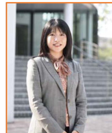
ユニット4を担当する勢一構成員