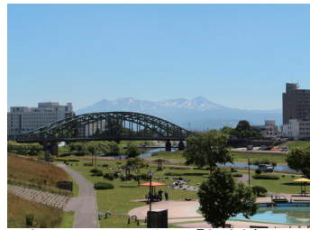
旭川のシンボル「旭橋」と大雪山連峰