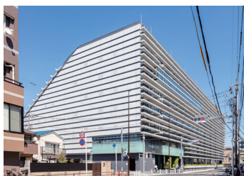
市川市役所新庁舎

議会フロアは6〜7階。議場レイアウトは2階吹き抜けとなっており、上層階に傍聴席を配置することで傍聴者から全体が見渡せる構造となっている。