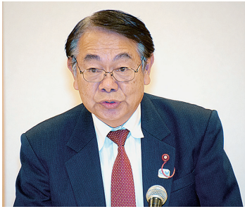
挨拶する新藤委員長