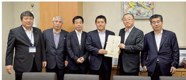
平井自民党地方議員年金検討PT委員