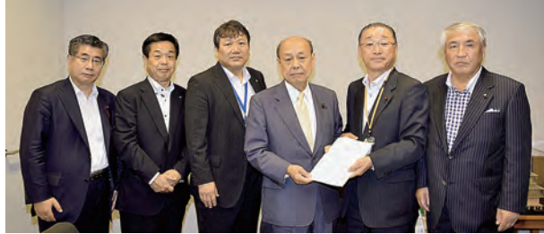
二之湯本会顧問・自民党地方議員年金検討PT委員