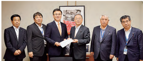
森屋自民党地方議員年金検討PT座長代行