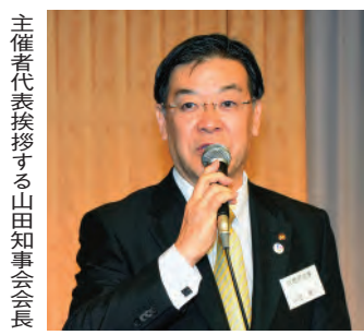
主催者代表挨拶する山田知事会会長