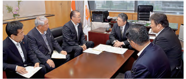
富樫総務大臣政務官