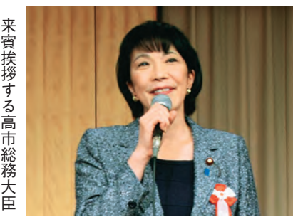
来賓挨拶する高市総務大臣