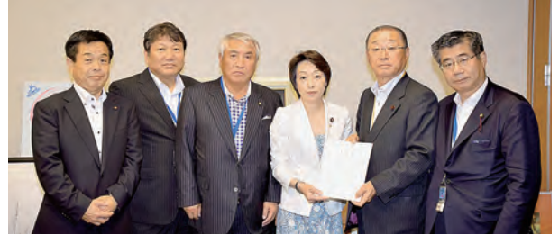
橋本自民党参議院議員会長