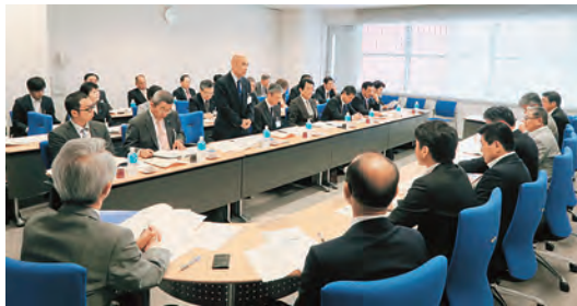
議会活性化調査特別委員会で野々市市を視察(挨拶する浅野議長)

ラーとなり、内容の充実とより分かりやすく、これまで以上に全市民の皆様へ愛読していただけるように努力を重ねていきます。