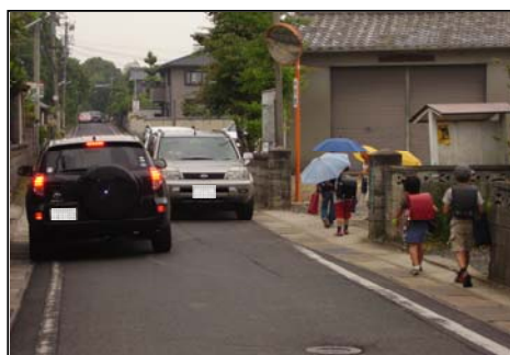
歩道やガードレールのない通学路

○都市部の渋滞解消のためには、開かずの踏切の解消や環状道路の整備が必要です。鉄道の連続立体交差化事業に必要な費用の9割は道路特定財源で賄われています。