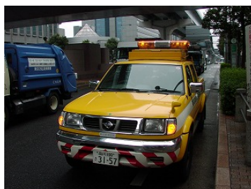
巡回車による巡回