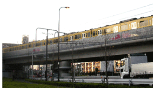
鉄道の連続立体交差化事業

○道路特定財源は道路建設だけでなく、維持管理にも使われています。道路の除雪やガードレールなどの交通安全施設の維持管理も道路特定財源で賄われています。